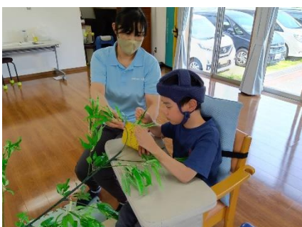
ササに取り付けます。