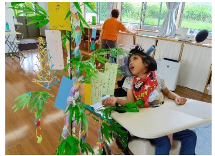
ササ飾りが綺麗です。