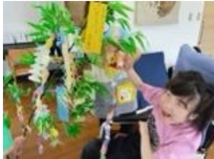
きれいに飾れたよ～！