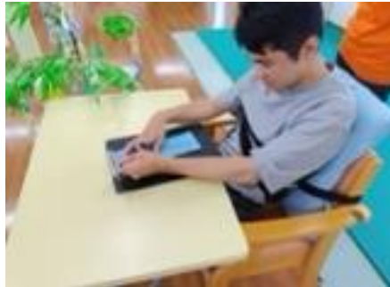
ぼくはお願い事、決まってるよ！