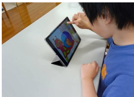
ぬり絵のゲームを！