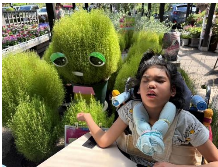
お花の苗買いに行きました！