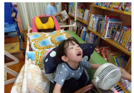
マイカーで図書室に！