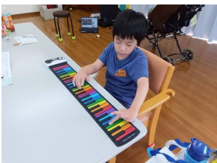
キーボードで遊ぶよ！