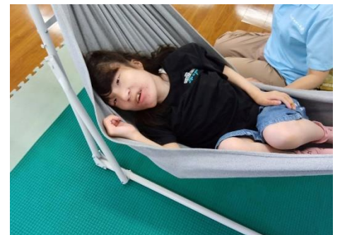
ハンモックでゆっくり